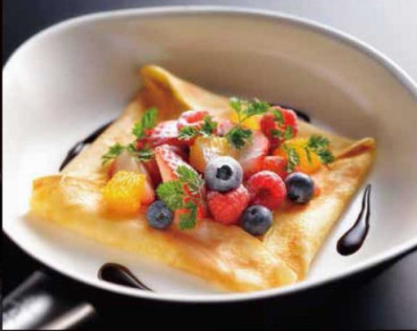
Aluminum Frying Pan Ceramic Coating アルミフライパン セラミックコーティング