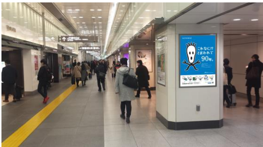
▲東京駅日本橋口通路の様子

東京駅構内には、数百枚のサインボードが掲示されています。その中で弊社のサインボードに注目していただくため重視したのが、インパクトとシンプルさ。数十メートル先からでも目を引く内容とするよう、弊社の登録商標である「マーシャン」を大きく表示しました。「マーシャン」は看板全体の半分をしめ、残り半分にコミカルなキャッチコピーをレイアウトしています。